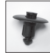
H011 push type cowl grille retainer arrêtir-poussoir de la grille du tablier retén de presión de rejilla del cubretablero